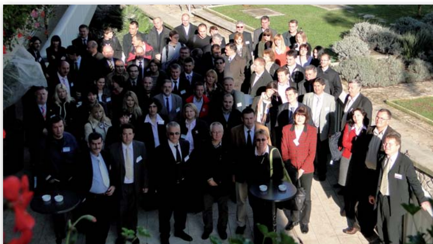
Sudionici 2. NIPP i INSPIRE dana, Opatija 25.11.2010.

Upravni odbor (Steering committee) sastavljen od direktora organizacija - funkcija usmjeravanja i praćenje provedbe svekolikog projekta. Izvršni odbor (Executive committee) sastavljen od predsjedavajućeg Upravnog odbora, predstavnika DG Enlargementa i izvoditelja - funkcija je usmjeravati i pratiti provedbu projekta između sastanaka Upravnog odbora i po potrebi rješavati hitna pitanja. Projektni tim korisnika sastavljen od po jednog predstavnika svake institucije na čelu kojeg je voditelj - zadatak projektnog tima je tehnička provedba projekta u svim njegovim elementima unutar svoje institucije i koordinacija i praćenje rada radnih skupina. Radne skupine korisnika koje će se uspostavljati bilo na razini cijelog projekta ili unutar pojedine institucije za provedbu pojedine aktivnosti projekta - zadatak je biti nositelj realizacije pojedine aktivnosti.