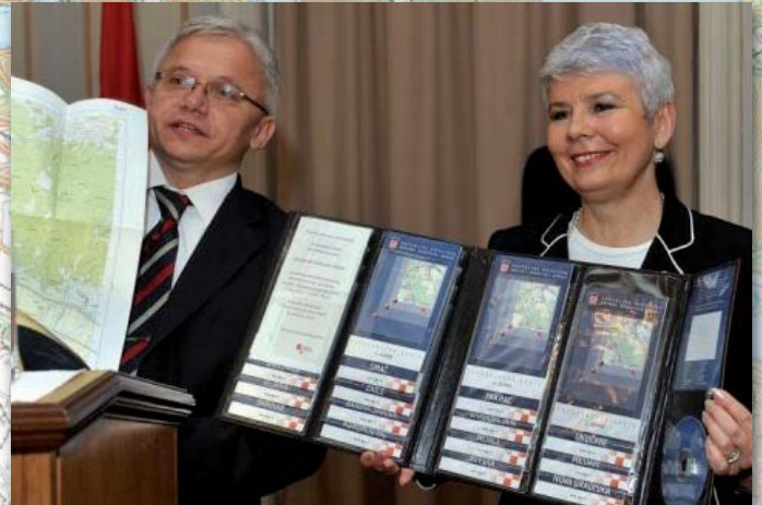
Na Akademiji, predsjednici Vlade gđi Jadranki Kosor, ravnatelj DGU Željko Bačić, poklonio je u znak sjećanja na ovaj za geodete i njihov rad važan događaj, set karata u kožnom etui

Nakon ravnatelja DGU skupu se obratila i predsjednica Vlade gđa. Jadranka Kosor riječima: „Velikim naporom cjelokupne ge-