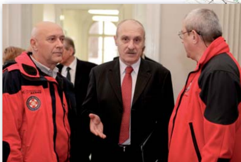
Predstavnici HGSS-a, DGU i HGSS imaju potpisani Sporazum o dugoročnoj suradnji u području službene i tematske kartografije u cilju unapređenja sigurnosti spašavanja u RH.