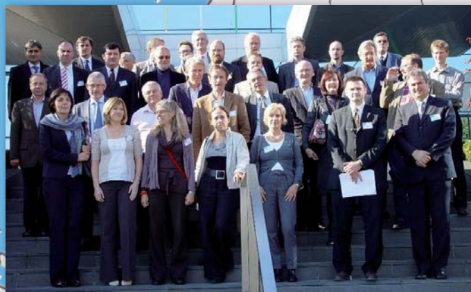
Sudionici 117. EUSDR skupa