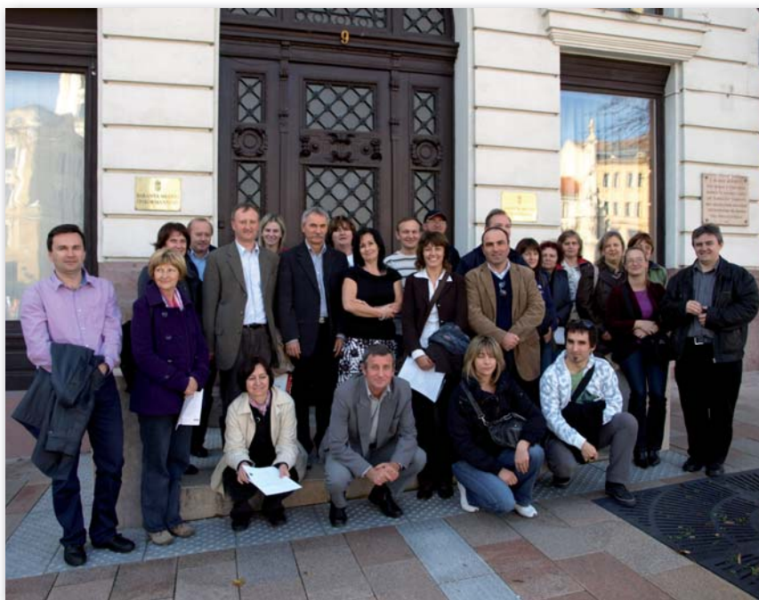
Članovi Udruge geodeta Koprivničko-križevačke županije s mađarskim kolegama u Pečuhu

Važno je napomenuti da su u postupku vektorizacije, samo 1 % činili katastarski planovi stare grafičke izmjere, dok je većina katastarskih planova u Mađarskoj nastala nakon 1960. godine na temelju fotogrametrijskog snimanja, što je omogućavala konfiguracija terena i veličina posjeda, posebno intravilana. Ovlašteni geodeti elaborate o