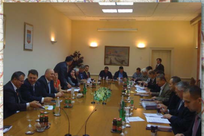
Potpisivanje Sporazuma između DGU i Osječko-baranjske županije