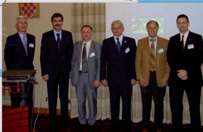
Predavači na 117. EUSDR skupu, Zagreb listopad 2010.

117. EuroSDR skup u Zagrebu će ostaviti traga na daljnjem radu i razvoju EuroSDR-a i područja geoinformacija zbog usvajanja novog EuroSDR Rolling Research Plan 2011 – 2014 , na novim projektima koji su inicirani na skupu, vrlo interesantnim pozivnim predavanjima, iniciranju suradnje s međunarodnim institucijama te inicijativi uključivanja zemalja regije u EuroSDR. Ovim skupom Hrvatska se predstavila kao zemlja domaćin i s obzirom na reakcije može se očekivati daljnji interes da Hrvatska bude nosilac EuroSDR aktivnosti. Više podataka o skupu, predavanjima, sudionicima i ostalim detaljima može se naći na službenim internet stranicama 117. EuroSDR skupa http://117eurosdr.cgi.hr .